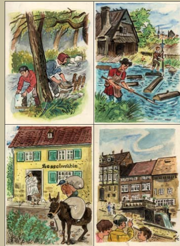
Kanalbau, Flößen, Mühle, Wasserkunst. Grafiken: Kurt Schote, 1998